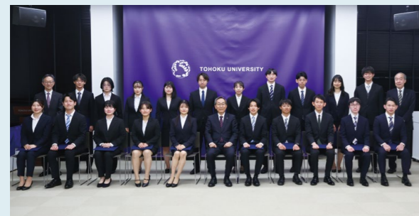
写真:2023年度第2回グローバルリーダー認定証授与式の様子

グローバルリーダーに認定されたTGL学生には、毎年2回開催される授与式にて、東北大学総長からグローバルリーダー認定証が授与されます。グローバルリーダー認定証は、在学中の海外留学や積極的な学びの姿勢などさまざまな取り組みが評価され、国際社会を牽引するリーダーとしての基礎的な能力を兼ね備えた学生であることを本学が認定した証明となります。※認定された学生には認定証の他に、東北大学公認のオープンバッジ(デジタル証明書)が発行されます。